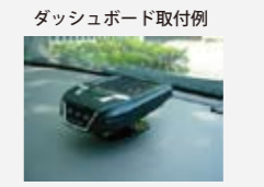
ダッシュボード取付例