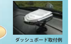
ダッシュボード取付例