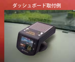
ダッシュボード取付例