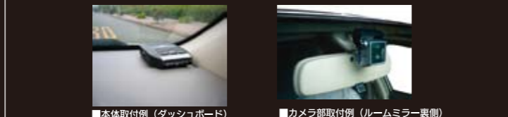
■本体取付例 (ダッシュボード)