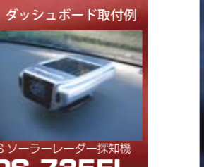
ダッシュボード取付例